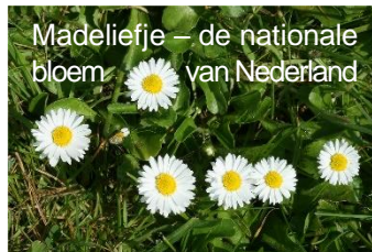
Madeliefje – de nationale bloem van Nederland

Volgens Natuurmonumenten is dit te verklaren doordat we de afgelopen decennia veel natuur zijn kwijtgeraakt. Maar het signaleert ook een verschuiving van het buitenleven en het natuurlijke naar het binnen- en virtuele.