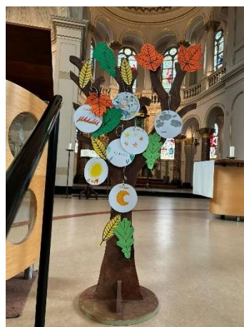
Elementen van het Zonneliied hangen in de boom.