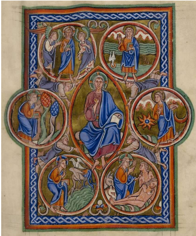
De Schepping. Miniatuur uit het Psalter van Lodewijk de Heilige, Leiden, UB, BPL 76 A, f. 7r

Scheppingsperiode — Op 1 september, de Wereldgebedsdag voor de zorg van de Schepping, begint weer de jaarlijkse Scheppingsperiode die wordt afgesloten op 4 oktober met het feest van Sint Franciscus. Ook in onze parochie wordt daar aandacht aan besteed. Het is een tijd waarin we de goedheid vieren van wat God geschapen heeft, we bidden voor het onrecht dat haar wordt aangedaan en we bezinnen ons op onze eigen manier van leven. Als jaarthema is gekozen voor: ‘Hoop en ons handelen met de Schepping’, dat ontleend is aan de Romeinenbrief.