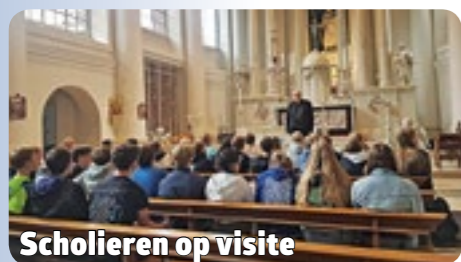
Scholieren op visite

In diverse kerken komen zo af en toe middelbare scholieren klassikaal een bezoekje brengen. Het is altijd leuk hen te ontvangen en hun vragen te horen. Op de foto een klas van het Vlietlandcollege in de Lodewijkkerk. Een katholiek kerkgebouw leent zich natuurlijk erg goed om én over de geschiedenis én over de sacramenten (biechtstoel!) en natuurlijk over Christus (altaar, kruisweg, beelden) te vertellen. Soms komen er ook scholieren langs voor een werkstuk. Laatst ging dat over 'de aflaten'. Opmerkelijk om zo'n onderwerp te kiezen. Hopelijk hebben deze leerlingen begrepen dat je met een aflaat geen plekje in de hemel koopt. Onze bisschop zegt, dat jongeren niet veel meer mee krijgen van huis uit, maar wel makkelijk over het geloof praten en vooral benieuwd zijn naar de relevantie van het geloof voor hun eigen leven.