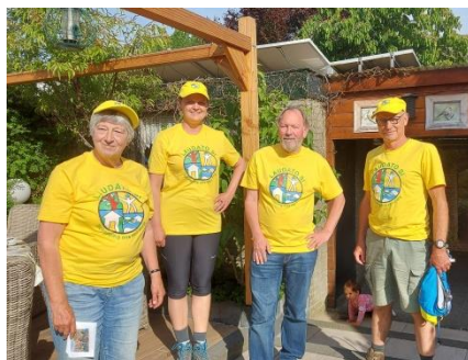
In training voor de 40km

Het doel van de wandeling is geld inzamelen voor de Stichting Vluchteling. Ons team laat zich graag sponsoren (door familie, vrienden, collega's en natuurlijk onze parochianen!).