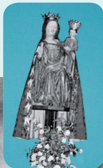
Verering van Maria van Jesse in de kapel.