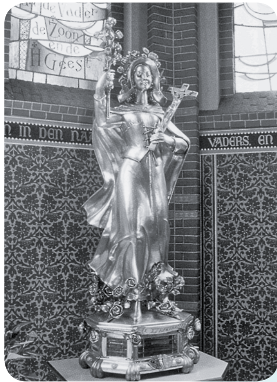
Het beeld van de H. Liduina van Schiedam in 'haar' kapel in de basiliek.