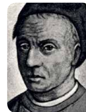
Thomas a Kempis