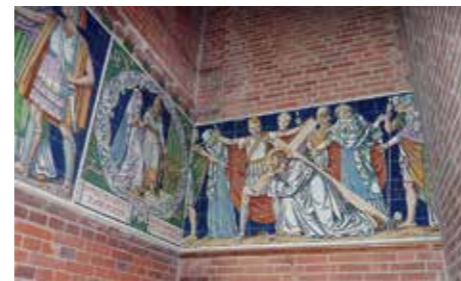
Gehavende Kruisweg Sint Jan. Te zien is dat het eerste deel ontbreekt. Het rechter deel loopt niet door in de 3e statie, dit deel is na de brand uit de puinhopen gered en bijgevoegd. In de huidige Sint Jan zijn alleen de staties 4 t/m 11 nog volledig aanwezig.

De werkzaamheden aan de Sint Jan zijn in volle gang. De bestaande vloer is inmiddels geheel uitgehakt om plaats te kunnen maken voor o.a. de leidingen voor de vloerverwarming. De vloer van de koorzolder is een stuk groter geworden en nabij de sacristie is een doorgang gemaakt om plek te creëren voor de CV-ketel en toebehoren. De bouwcommissie is ook bezig met de vraag of en hoe de Kruisweg weer compleet te maken is. Door de brand in 1964 zijn een aantal van de staties verloren gegaan.