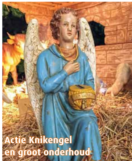
Actie Knikengel en groot onderhoud

Met Kerstmis 2015 werd de actie Knikengel gelanceerd voor groot onderhoud. De actie werd een groot succes. Eind december 2016 was bijna € 15.000,- opgehaald en af en toe komen er nog heel mooie bedragen binnen voor NL85 INGB 0000 1859 91. Veel dank voor alle gulle bijdragen, waaronder extra giften bij bijzondere gelegenheden zoals een 50-jarig huweljk. Omdat onze Petruskerk een rijksmonument is, krijgen wij ook subsidie van het Nationaal Restauratiefonds.