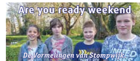
De Vormelingen van Stompwijk.