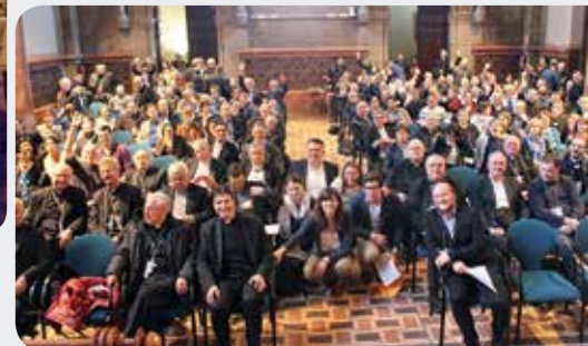
De deelnemers aan het symposium in het seminarie van Barcelona.

selijke manier, tot de verschillende zintuigen en uiteindelijk in het bijzonder tot het hart van mensen.