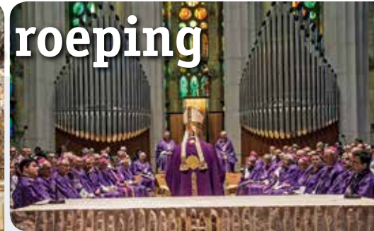
H. Mis op het priesterkoor van de Sagrada Familia.

Ook zijn er allerlei hulpmiddelen. Zo werd het van oorsprong Leidse project Twitteren met GOD, dat inmiddels in tientallen landen wordt gebruikt, geciteerd als een goede manier om jonge mensen te begeleiden. Een bezoek aan de basiliek van de Sagrada Familia toonde een prachtig voorbeeld van de rol van schoonheid, kunst, architectuur en liturgie in de begeleiding. Deze spreken, ieder op een eigen manier, een heel men-