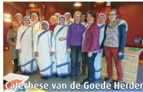
Catechese van de Goede Herder

Naar aanleiding van de restauratie is het initiatief genomen een oude Congregatie opnieuw op te richten: de Vrienden van Sint Joseph. Inmiddels hebben al heel wat mensen zich ingeschreven. Het gaat er om Sint Joseph een grote plaats te geven in ons geloofsleven, jaarlijks, maandelijks, wekelijks, dagelijks. Zo is er elke 2e woensdag van de maand een speciale Sint Josephmis. Flyers met informatie liggen achter in de kerk. Nu is ook het bij behorende Sint Josephboekje verschenen. Hier staan Josephgebeden voor elke dag van de week in, teksten van heiligen en pausen over Sint Joseph en vijf Josephliederen. Iedereen die zich heeft aangemeld of dit nog doet bij de Vrienden van Sint Joseph kan zo'n boekje krijgen. Vraag er even naar! Pastoor Smith