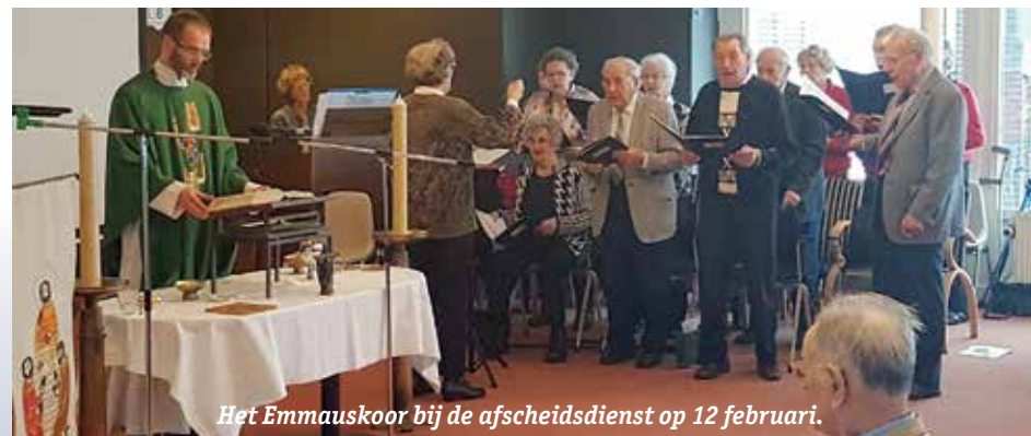
Het Emmauskoor bij de afscheidsdienst op 12 februari.