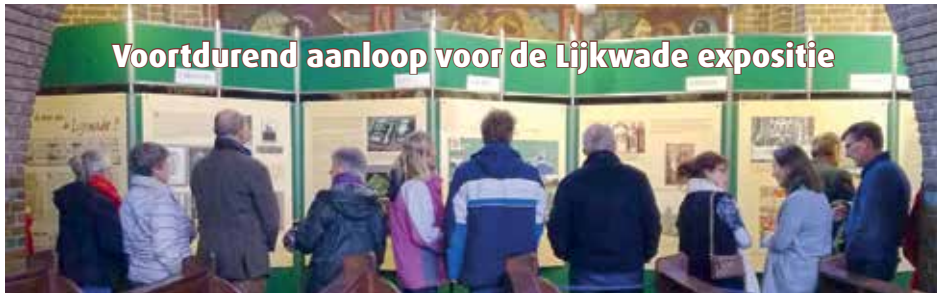
Voortdurend aanloop voor de Lijkwade expositie