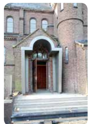
De zijdeur van de Meerburg gaat overdag open.

Welke deuren gaan er dicht? Die van De Menswording in Leiderdorp. Na tientallen jaren het hart te zijn geweest van de bloeiende R.K.-geloofsgemeenschap ter plaatse is de allerlaatste viering in deze naoorlogse kerk op 11 december, vlak na het uitkomen van dit blad. Deze sluiting doet veel pijn, maar is definitief. De deuren van de Sint Jan aan de Zuidbuurtseweg in Zoeterwoude gaan op oudejaarsavond dicht, maar slechts voor 1 jaar - als alles volgens plan verloopt. De kerk wordt opnieuw ingericht en het complex krijgt extra functies vanwege de naastgelegen begraafplaats. Dat laatste brengt me naar de deuren die opengaan. Op 17 december wordt de Onze Lieve Vrouw Onbevlekt Ontvangenkerk aan de Hoge Rijndijk in Zoeterwoude, bekend als de Meerburgkerk, opnieuw ingewijd als 'De Goede Herder' en wordt een gastvrij huis voor parochianen uit Leiderdorp en de Rijndijkers. Naast de heringerichte kerk komt een ruimte om overledenen op te baren. (Zie ook pagina 1, red.)